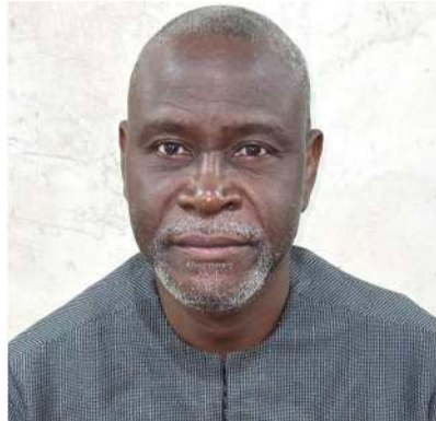
Presse : Le crépuscule des «As»

La semaine qui s'achève (19-25 mars 2026) aura été celle d'un étrange paradoxe guinéen : un pays qui pleure ses icônes tout en scrutant avec anxiété les soubresauts d'un monde en flammes. Entre l'émotion légitime des salles de rédaction et la réalité implacable des marchés, la Guinée cherche son équilibre sur une corde raide.