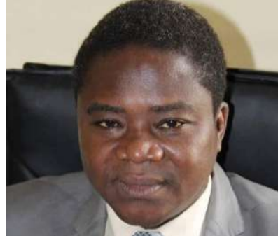
Un monument de la «Belle Époque» de la presse écrite