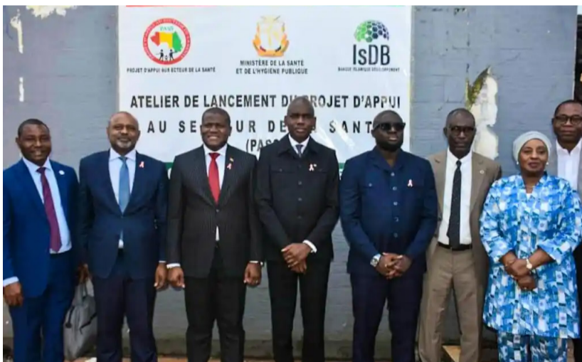
Le ministre de la Santé et de l'Hygiène Publique, accompagné de ses collègues ministres du Plan et de la Coopération Internationale et de l'Urbanisme et de l'Habitat, a procédé, le mardi 7 octobre 2025, au lancement officiel du projet d'appui au secteur de la santé (PASS).