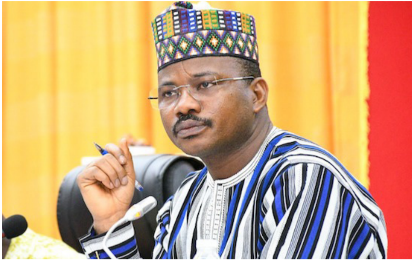
Le président du CNT, Dr Dansa Kourouma, a livré un message après l'adoption de la nouvelle constitution en république de Guinée. Lisez...

« Le projet de nouvelle Constitution, soumis au référendum, a été adopté avec un taux de participation remarquable de 86,42 %. Sur l'ensemble des suffrages exprimés, 5 135 951 Guinéennes et Guinéens, soit 89,38 %, ont choisi de voter OUI, tandis que 610 376 électeurs, représentant 10,62 %, se sont prononcés pour le NON. Suite à la validation des résultats par la Cour suprême ce vendredi 26 septembre, le Président de la République a promulgué, par décret, la nouvelle Constitution. De tels taux de participation et d'adhésion constituent un élan d'espoir pour la Guinée. C'est pourquoi, en ce jour mémorable pour notre pays, mes pensées premières s'élèvent vers Dieu, le créateur, l'omnipotent, l'omniscient et l'omniprésent, qui, dans son infinie sagesse, nous a permis de vivre cet instant historique. C'est avec une profonde gratitude que je rends grâce pour la force, l'inspiration et la clairvoyance qu'il nous a accordées tout au long de ce processus décisif pour l'avenir de notre pays. Je voudrais exprimer ma recon-