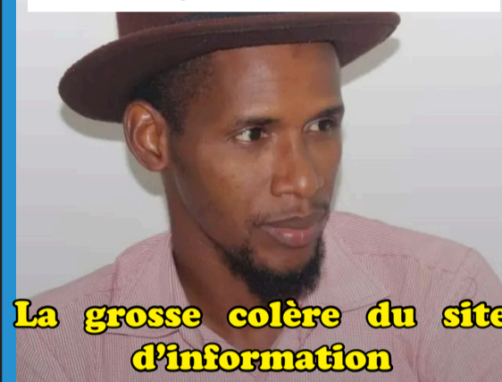
La grosse colère du site d'information

Suspension de Guinee360.com pour 3 mois P.2