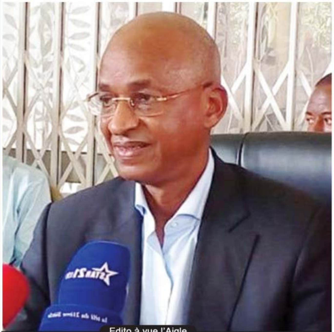
Edito à vue l'Aigle